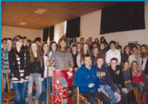
Een Romein op school

soneel. Het resultaat is een wervelende avondvoorstelling die volle zalen trekt.