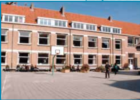
Nestor de Tièrestraat