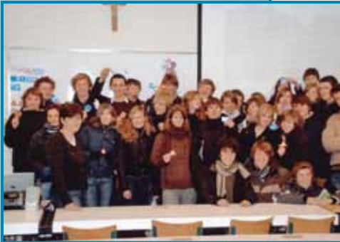
Rijbewijs op school