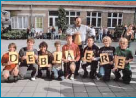
Europese dag van de talen