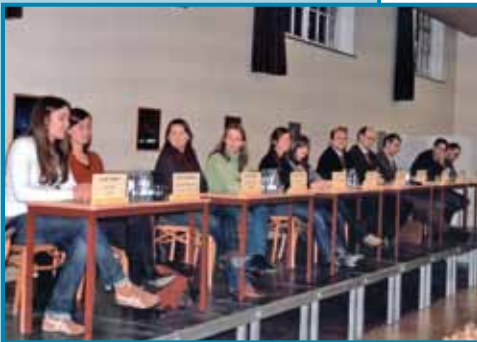
Info-avond: hoger onderwijs

voor het vak economie, het maken van grafieken en de statistische verwerking van gegevens met de grafische rekenmachine in de lessen wiskunde of fysica - het bewijst allemaal dat ICT een didactische meerwaarde betekent in ons hedendaags onderwijs.