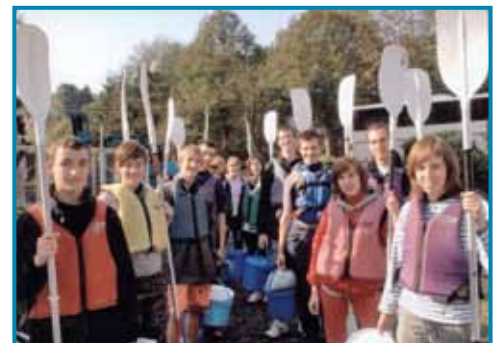
Afvaart van de Lesse

Een levensstijl met voldoende lichaamsbeweging, dat is het hoofddoel van de lessen lichamelijke opvoeding . Dit zou inderdaad moeten leiden tot gezondere volwassenen die minder onderhevig zijn aan de zogenaamde beschavingsziekten. Hierbij staat de ontwikkeling van een positieve ingesteldheid ten aanzien van lichamelijke activiteiten en beweging centraal. De zin voor inspanning is een waarde op zich. Andere opvoedkundige doelstellingen zijn karaktervorming, een positief zelfbeeld en het ontwikkelen van goede sociale relaties. Dat er hard en systematisch gewerkt wordt aan de fysieke conditie van de leerlingen aan ons toevertrouwd, bewijzen de resultaten die geregeld meege-