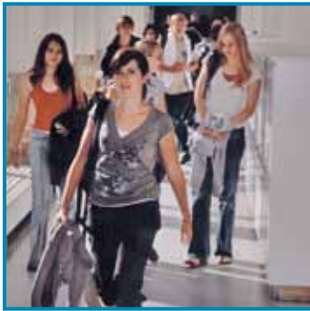
Op naar het volgende lesuur