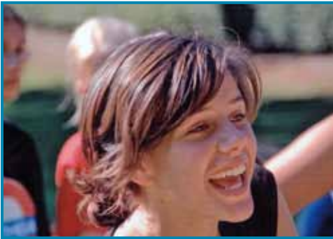
Nog een enthousiaste leerlinge!

Geregeld neemt het Sint-Jozefslyceum ook deel aan olympiades, aan opstelwedstrijden en welsprekendheidstornooien en met succes.