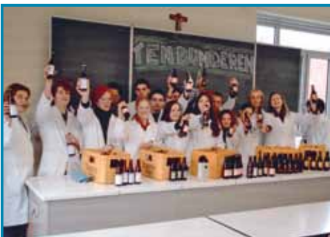
Project vrije ruimte: bierbrouwen

Voor de bromfietsen is net voor de sportzaal een parkeerplaats aangelegd, voorzien van grondankers om de bromfietsen vast te leggen.